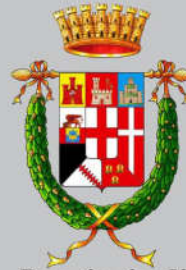
Provincia di Padova