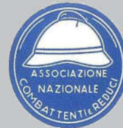
Federazione di Padova