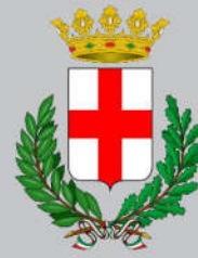
Comune di Padova