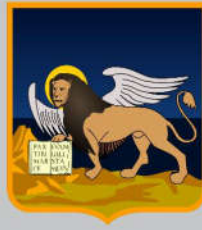
Regione del Veneto