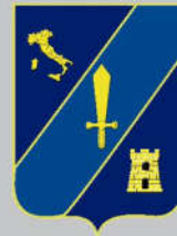
Comando Forze Operative Nord